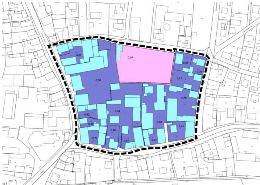
Ermittlung der bestehenden Grundflächenzahlen (GRZ), o.M.

Aufgrund der teilweise recht großen überbaubaren Flächen wurde die maximal zulässige Grundfläche pro Wohnbaukörper auf 240 qm begrenzt. Davon ausgenommen ist geförderter Wohnungsbau und Betreutes Wohnen mit Serviceeinheit.