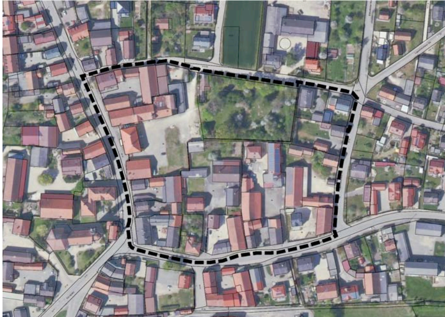
Luftbild mit dem Geltungsbereich des Bebauungsplanes, o-M-

Das Planungsgebiet ist nahezu eben, vollständig erschlossen, Ver- und Entsorgung gesichert.