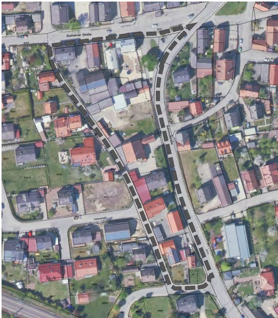
Luftbild mit dem Geltungsbereich des Bebauungsplanes, o-M-