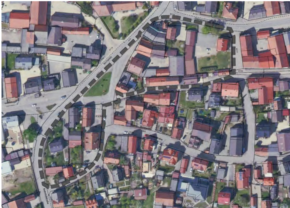
Luftbild mit dem Geltungsbereich des Bebauungsplanes, o-M-