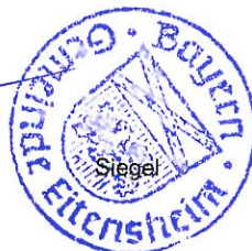
Manfred Diepold 1. Bürgermeister

Ortsüblich bekannt gemacht durch Anschlag an der Amtstafel Angeheftet am: 30.11.2020 Abgenommen am: 21.12.2020